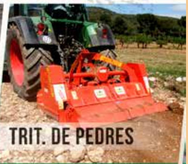
TRIT. DE PEDRES

- NO COMPRI AVUI EL QUE POTSER NO LI SERVEIX DEMÀ -