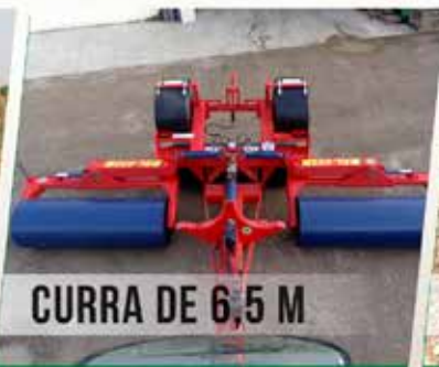
CURRA DE 6,5 M